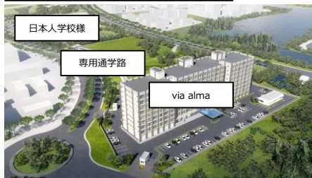
日本人学校様との位置関係