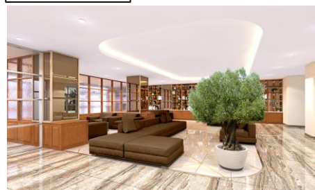
共用エントランス