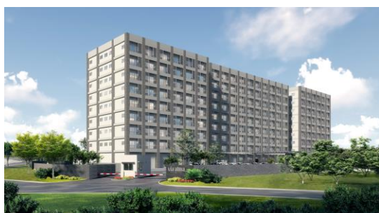
北側からの当施設外観

この事業を通じ、両社とが一体となり、インドネシアでJapan Quality(日本品質)の安全・安心の住環境を提供することで、現地に住まう方々の暮らしの更なる質向上に貢献してまいります。