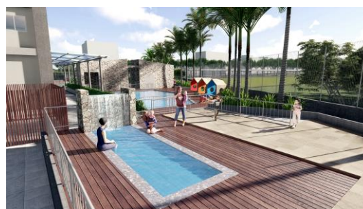
屋外キッズプール