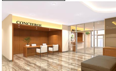
エントランス コンシェルジュ