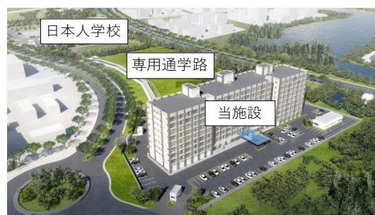
日本人学校への専用通学路