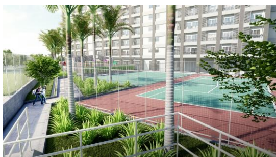
テニスコート・フットサルコート